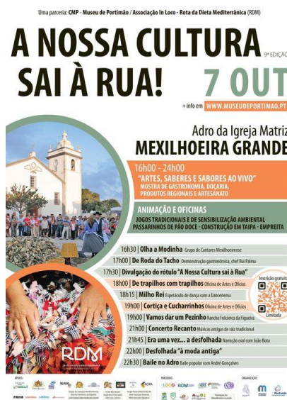
A Nossa Cultura Sai à Rua