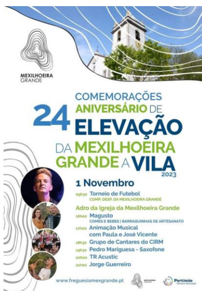
24 Aniversário da Elevação da Mexilhoeira Grande a Vila