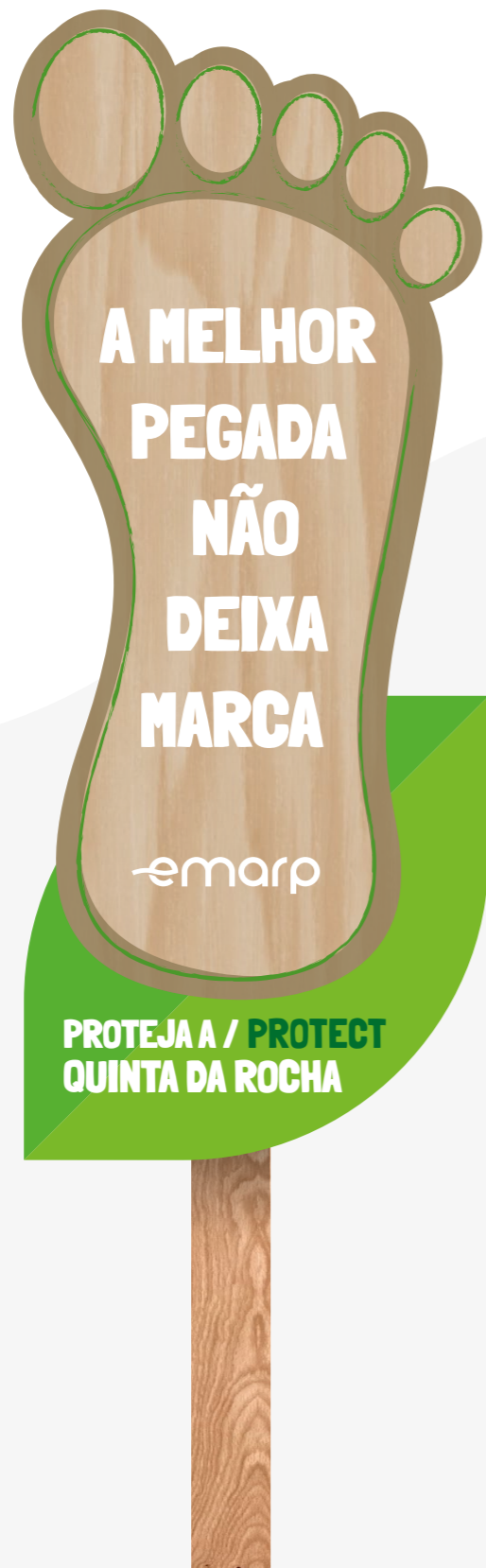
PLACA SINALÉTICA ENTRADA